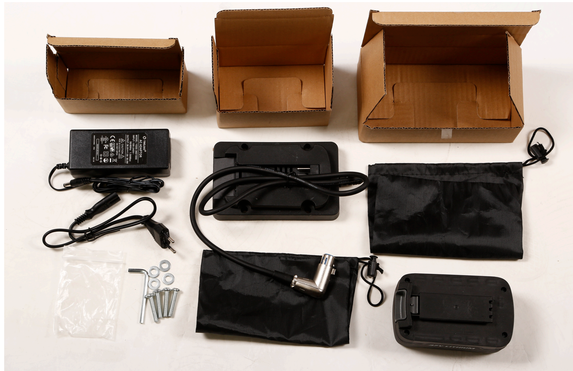
Batterifeste monteres med 4 stk skruer